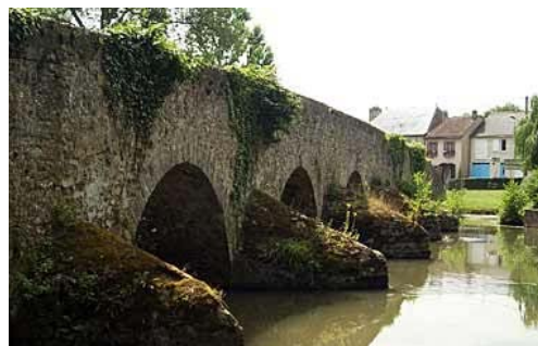
Pont Romain – Yvré