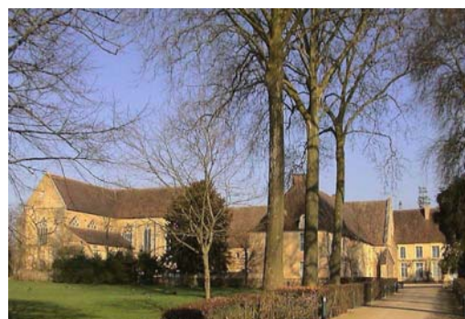
Abbaye de l'Épau