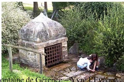
Fontaine de Gérence – Yvré l'Évêque

Un musée des eaux existe à 500m de l'Abbaye